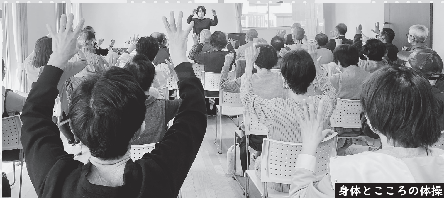
身体とこころの体操