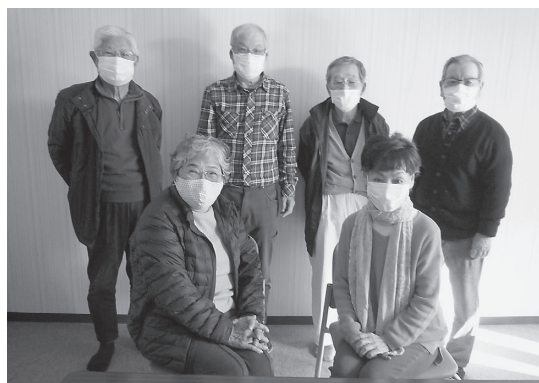
楽農クラブのみなさん

楽しく農業をすることを目標として活動をされる中、「できた野菜で少しでも住民の方々に喜んでもらえたら。」とお話されていました。