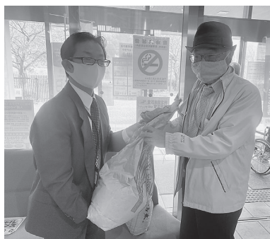
株式会社タツタ住宅様から、 新米などをいただきました!!

残念ながら、ご協力いただいた方お一人おひとりをご紹介することはできませんが、助け合いの輪が着実に広がっています。あたたかいお気持ちとともに貴重な品々をお預かりする職員にも力が入ります!ご協力者やお届け先の皆様のお顔を思い浮かべながら、ていねいに袋詰めなどの作業を行い、月一回、コロナ禍等でお困りのご家庭や