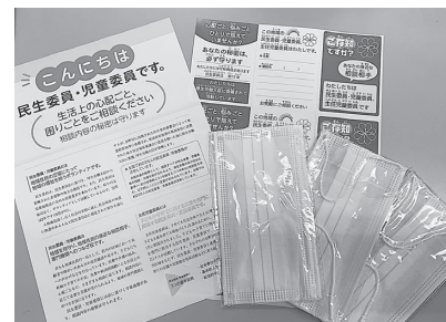
地域の高齢者へマスクの配布 (民生児童委員協議会)