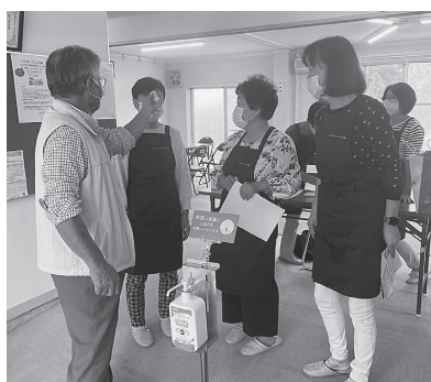
検温・消毒・マスク着用・参加者名簿の作成・お茶はセルフサービスで (小地域ネットワーク活動)