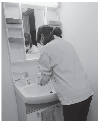
サービス提供前には、スタッフの 手洗い・消毒を徹底(訪問介護事業)