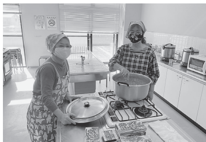
会食を休止し、必要なお家庭へカレーライスの デリバリー(地域食堂おかえり)