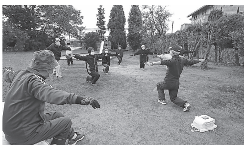
屋外での活発な活動で自粛生活中的運動不足を解消 (地域でのラジオ体操)