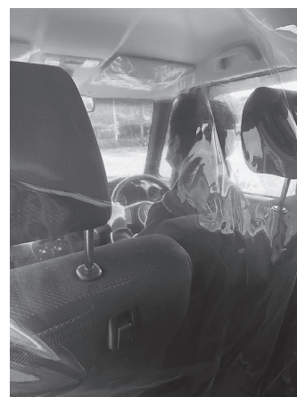
車内に防護シートを張り飛沫対策 (福祉有償運送事業)