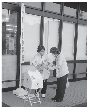
感染防止策を施しながらの 街頭募金活動(共同募金運動)