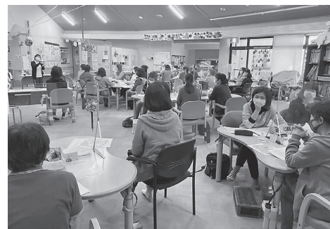
介護従事者に対し研修会を開催、感染防止対策 や様々な現場対応を学習(ホームヘルパー研修)