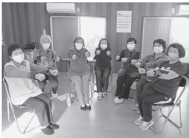
「福貴団地百歳体操」のみなさん