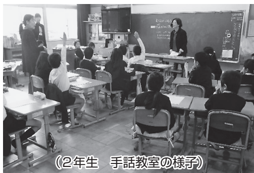
(2年生 手話教室の様子)