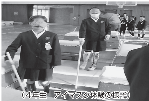
(4年生 アイマスク体験の様子)