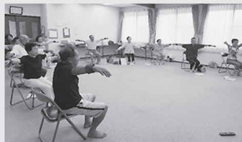
☆上庄台・月見台の様子☆

毎週30名以上の方が集まっています。体操を始めてから3カ月後の体力測定の結果も良くなり、効果が出ています。モデル期間が終了しても継続されています。