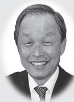
社会福祉法人 平群町社会福祉協議会