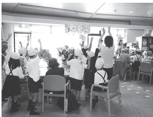
うちわりレーで勝ちました!!

11月12日(木)に、平群小学校2年生の生徒さん67名がデイサービスに来てくださいました。