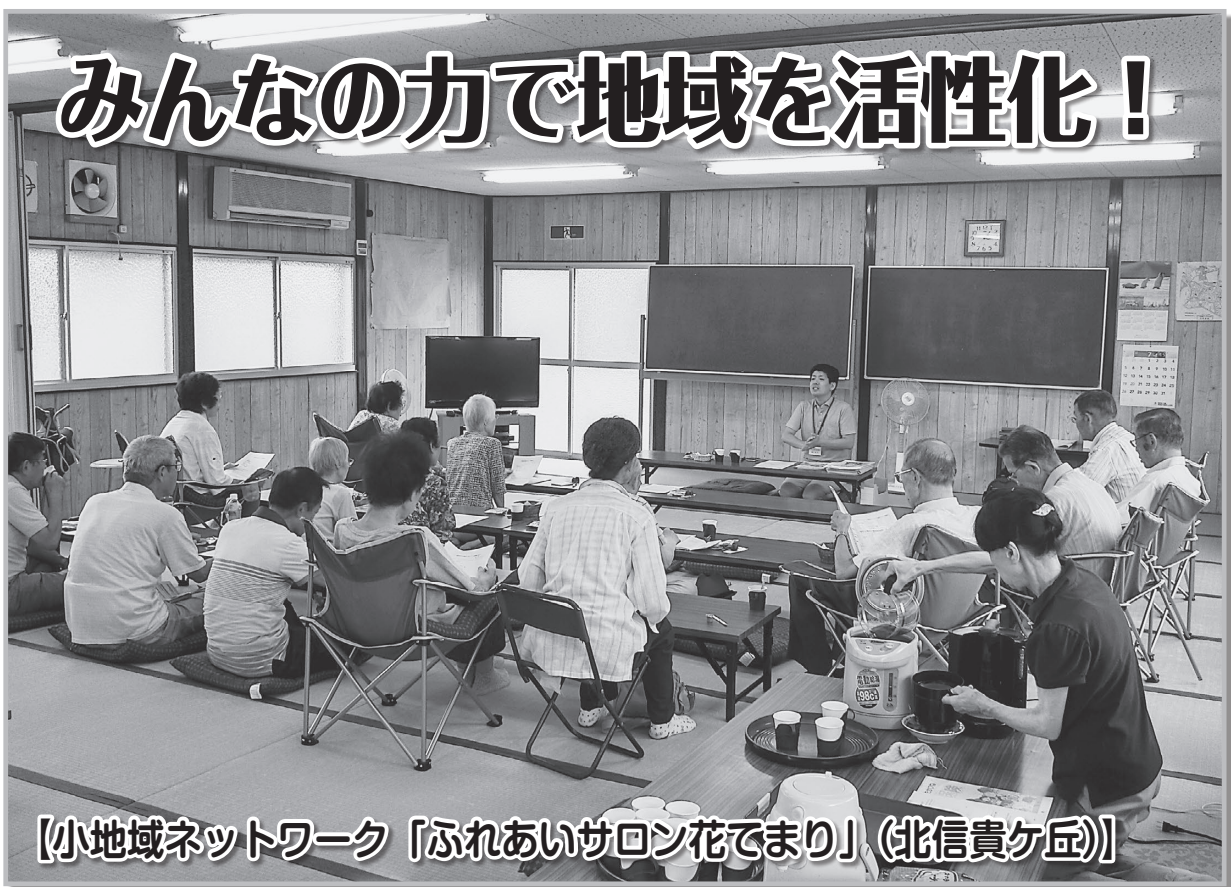
【小地域ネットワーク「ふれあいサロン花でまり」(北信貴ヶ丘)】