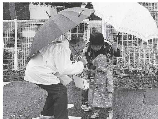
収穫祭での募金の様子