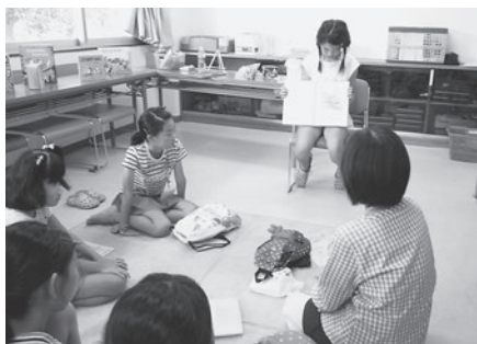
「読み聞かせは、きんちょうする〜」