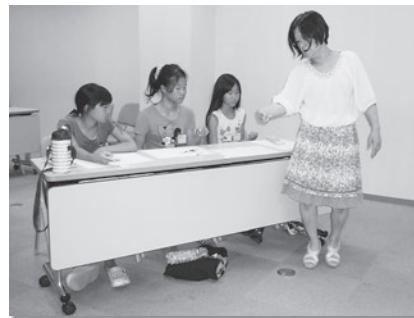
「自分の名前を手話で表そう～」