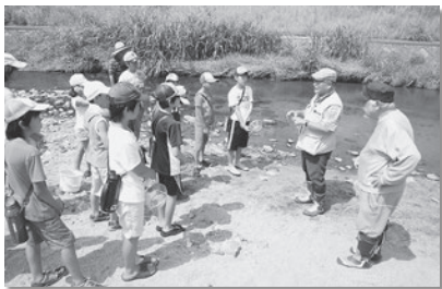
「どんな生物がいるのか楽しみ〜！」