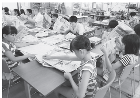
「みんなですると、楽しいね〜」