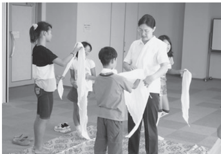
「何回も練習をして覚えるぞー！」