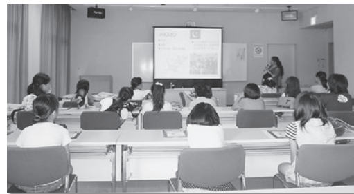
「アジア・アフリカの国について学習している様子」

★点字の本をパソコンで作ったり、本を読んで録音したりしていることを初めて知った。