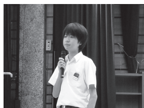
生徒代表のあいさつ

生徒代表から、「今日の講演会で薬物が体に及ぼす影響を学びました。また、薬物使用で恐ろしい結果につながることも知りました。これから夏休みに入りますが、甘い誘惑に負けることなく健全に過ごしていきたいと思います」との感想がありました。