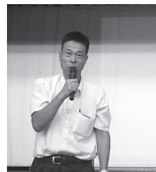
吉田氏の講演の様子

当日は、平群中学校3年生の参加も含め、約200名の参加者がありました。 この講演会は、最近、ニュースでよく取り上げられている脱法ドラッグ・覚せい剤などについての知識を習得し、地域住民全体で薬物被害から青少年を守るまちづくりを実現することを目的としています。