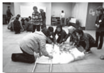
▲身近にあるものを工夫すればできる!!

の応急手当と物干し竿と毛布でタシカを作りケガ人を運ぶ方法を学びました。受講生の皆さんは、「次は自分たちの地域で回を重ねて身につけたい。普段から意識を持つことが大切だ」と感想を述べられていました。