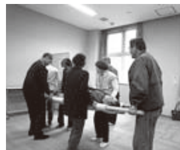
▲みんなで助け合って生き残るぞ!