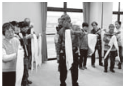
▲三角巾のたたみ方・結び方は難しい!

から隣近所の方とコミュニケーションをとって「いざ!」という時の声掛け・助ける役割を決めておくことと慌てずに避難できるなど、住民の助け合いなくして命は救えない。地域で活躍されている皆さんは助けられる側ではなく、助ける側になって平時から意識を持って防災活動に取り組んでほしいという熱いお話しに、参加者は熱心に耳を傾けていました。