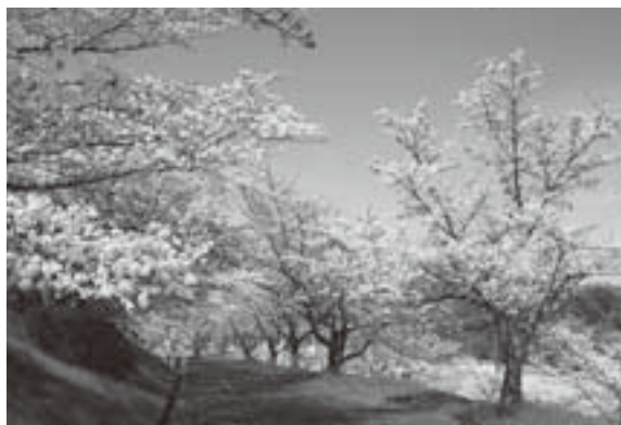
学園の小道の桜が咲き誇っていました

お花見に 行きました 4月1日(火)～4月7日(月)にかけて三郷町の奈良学園大学へお花見に行きました。満開の桜の木の下でおやつを食べ、気持ちのいいひとときをすごしました。