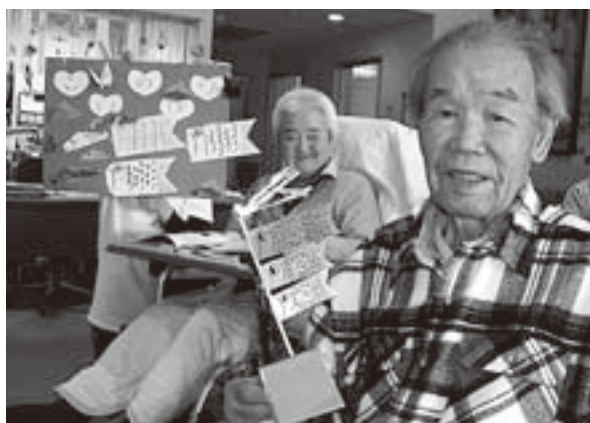
手作りこいのぼりの完成!!

牛乳パックに折り紙を貼ってつくった屋根に、画用紙とストローを差して、こいのぼり飾りを製作しました。晴天の空にたなびくかわいい作品ができました。