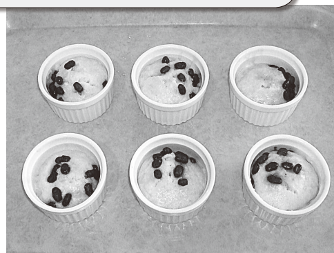
完成した蒸しパン！おいしそう…