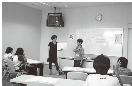
「手話でクイズ!!」 当ててみよう

耳の不自由な方の生活、震災時の避難生活の話。手話でのコミュニケーション方法を学びました。