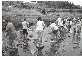
竜田川・かしのき荘付近にて

実際に川に入り、川の水や生き物にふれ、川がぐんと身近になりました。自然の大切さを学びました。