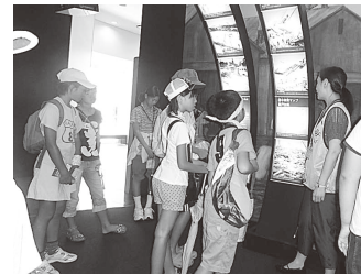
大阪市西区 津波・高潮ステーションにて

★津波と高潮の違いを知れて良かった。 ★津波は怖い。実際は想像以上にもっと怖い。