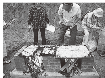
「美味しい焼きそばを作るで！」

を炒め始めました。しばらくするとソーの美味しいうな香りが……。すべての参加者が焼きそばの味を楽しみ、そして防災かまどベンチの完成を喜んでいました。