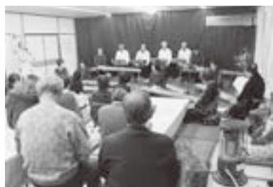
琴と尺八演奏で心が清らくなりました